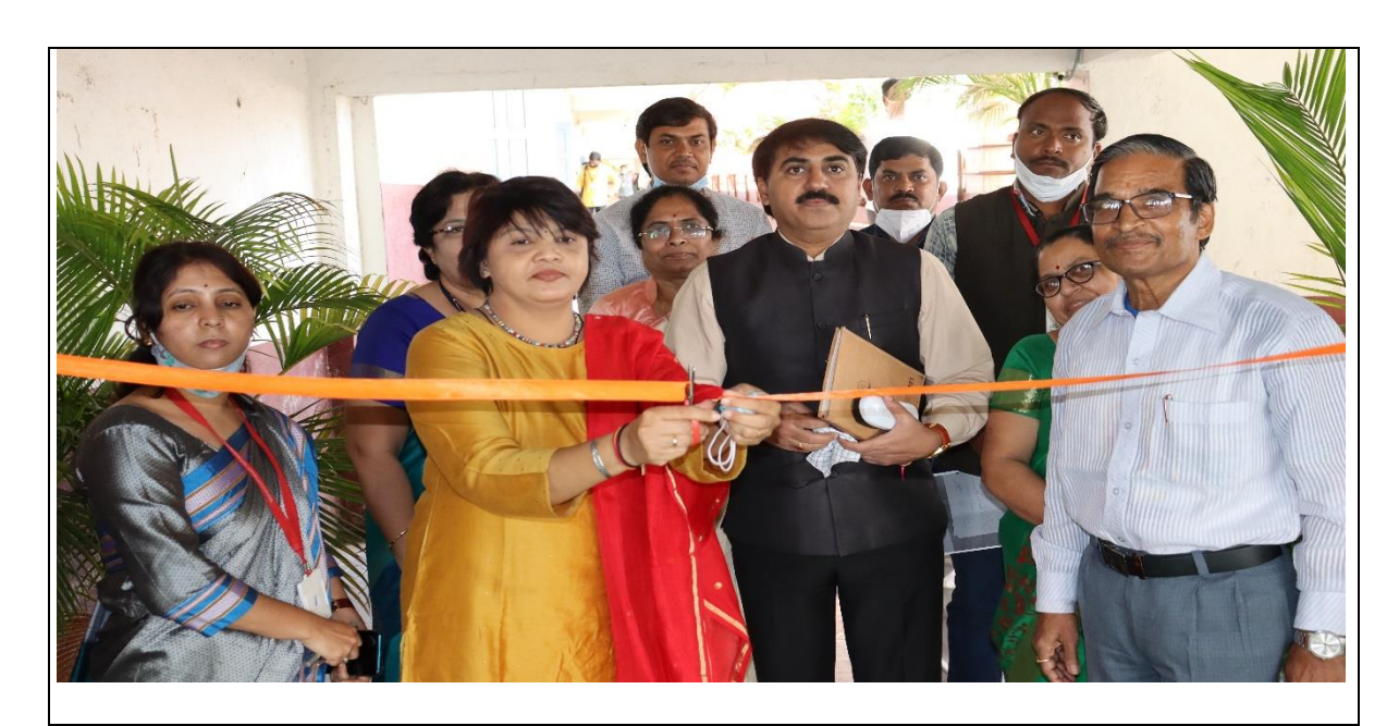
The program was inaugurated by Hon'ble Trupti Andhare (District Education Officer) with all Dignitaries