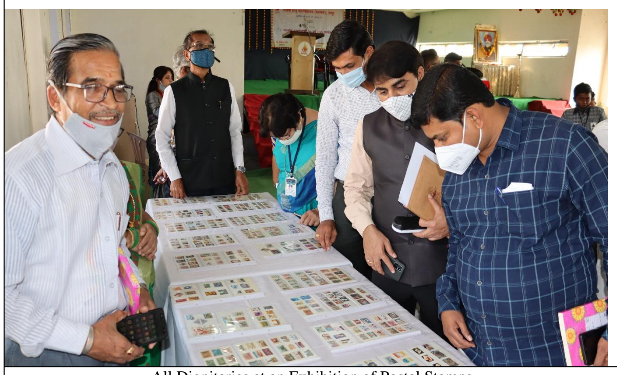
All Dignitaries at an Exhibition of Postal Stamps