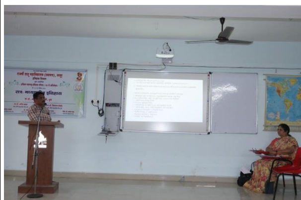
Paper Reading Session - History of Medieval India