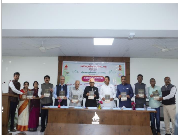
All Dignitaries while Proceeding Publication