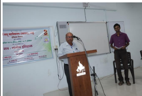
Paper Reading Session - History of Ancient India