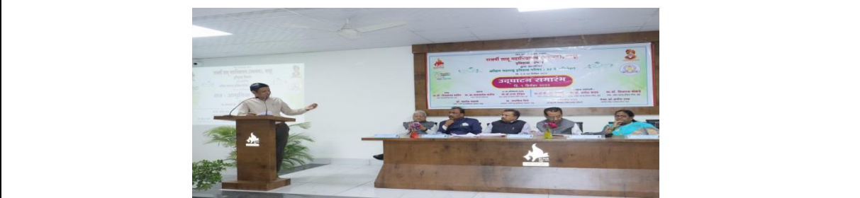
Paper Reading Session - History of Modern India