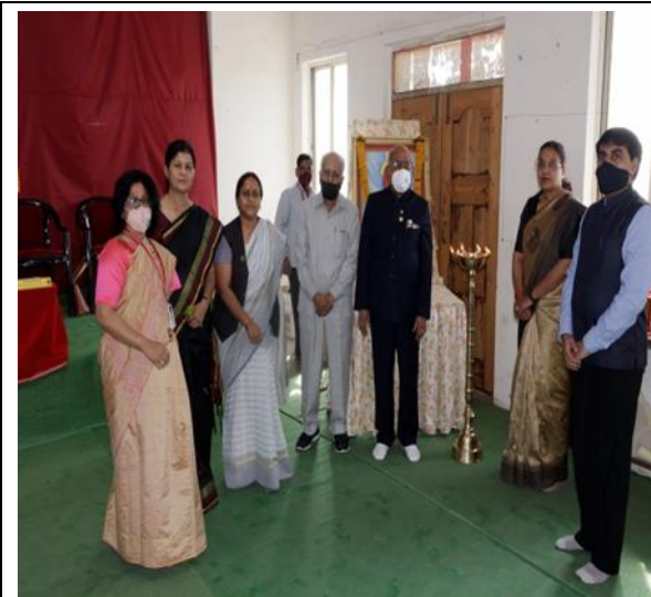
Inauguration of LAP