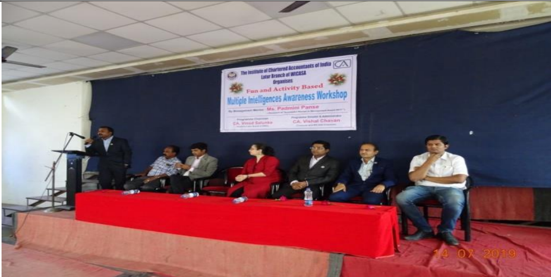
Recourse Person explaining the topic regarding the CA and CS courses