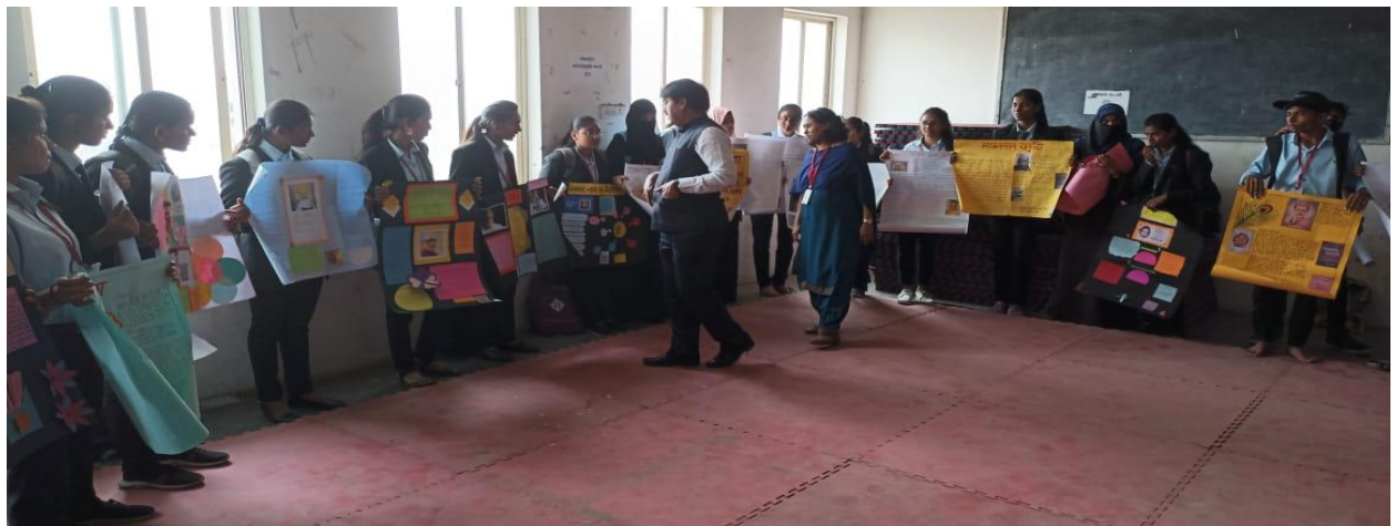
हिंदी विभाग की ओर से आयोजित हिंदी रचनाकारों से परिचय – पोस्टर प्रस्तुति कार्यक्रम में उपस्थित सभी विद्यार्थी ...