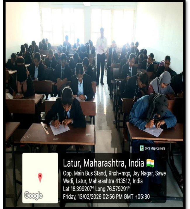
परीक्षेस उपस्थित विद्यार्थी

D) Link of Video of the programme if any (Video may be uploaded on college website/ YouTube, etc.) nil