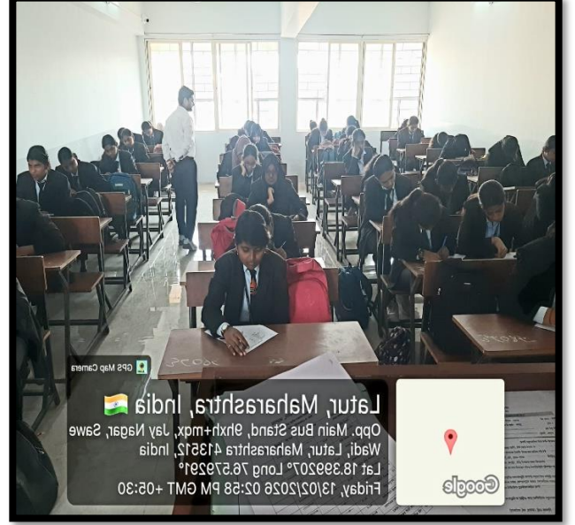
परीक्षेस उपस्थित विद्यार्थी