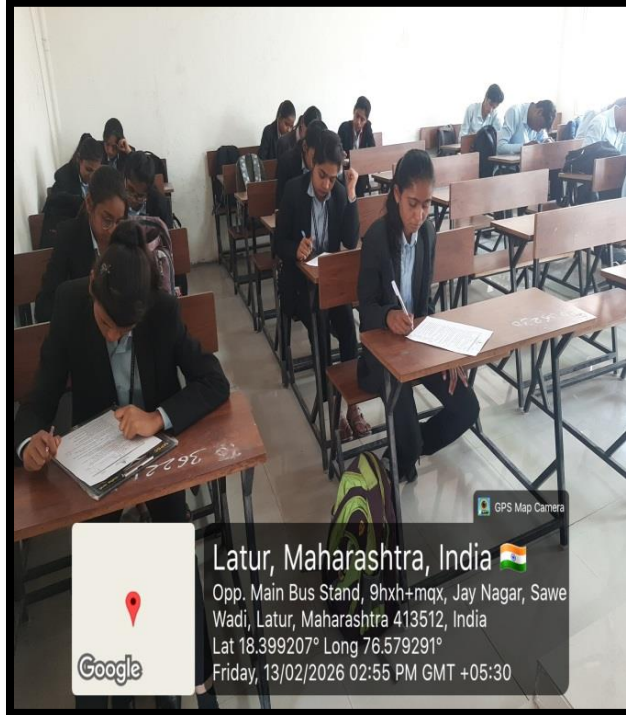
परीक्षेस उपस्थित विद्यार्थी