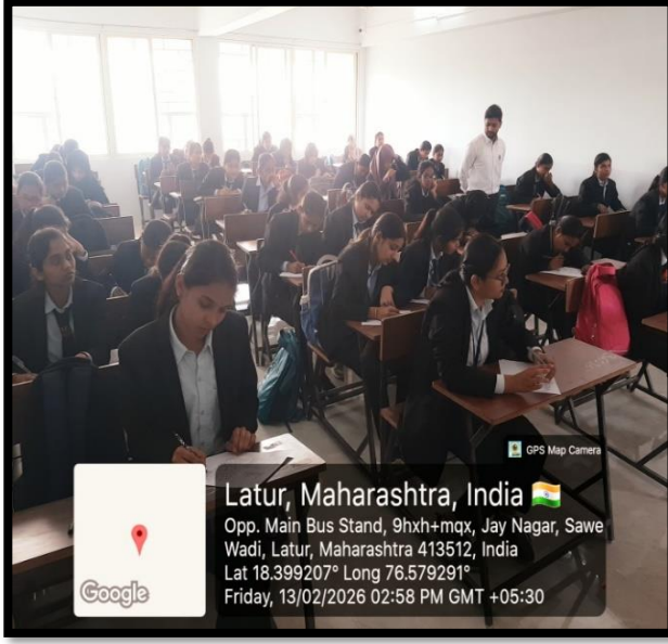
परीक्षेस उपस्थित विद्यार्थी

C) Geotagged – Not more Than 5 Photos (hard and soft copies to be maintained by the department/ Unit).