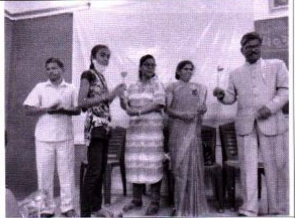
प्रमुख पाहुण्यांचे स्वागत