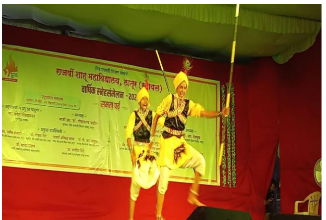
Hariyanvi Folk Dance