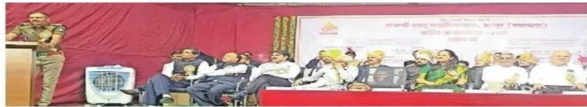
राजर्षी शाहू महाविद्यालयाच्या तीन दिवसीय समता पर्व:वार्षिक स्नेहसंमेलन कार्यक्रमाप्रसंगी मान्यवर.