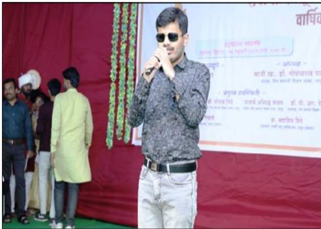
Blind Student He was singing a song at the inauguration Program.