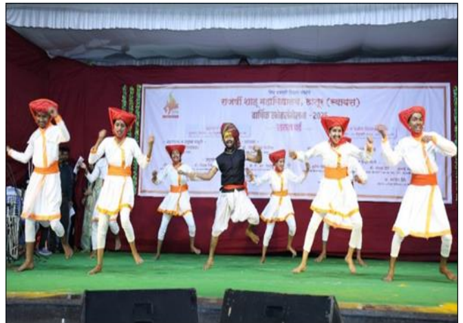
Marathi Folk Dance