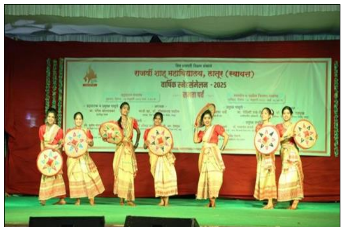
Aasam Bihu Folk Dance