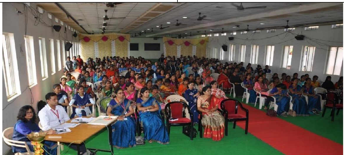
Women participants, faculty members & students attending the workshop