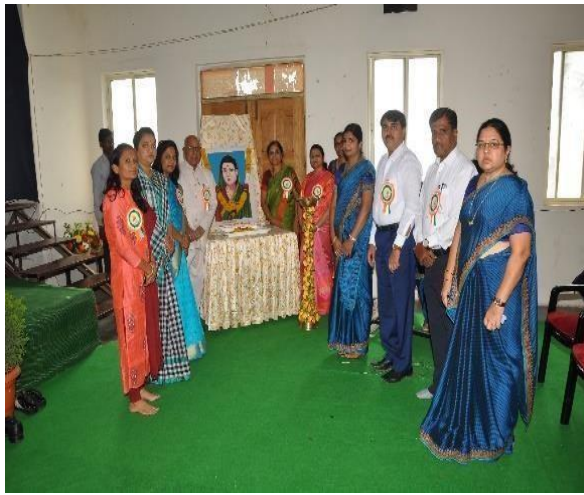
Honorable Dignitaries Lighting the lamp