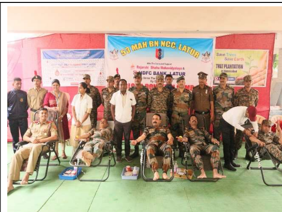
Blood Donors during camp