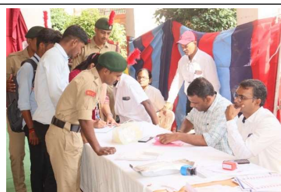
Moment while donors check ups