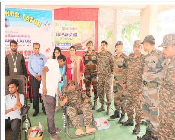
Blood Donors during camp