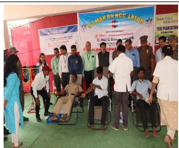
Donar Cadets and students during camp