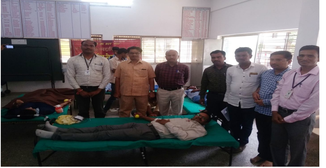
BLOOD DONATION CAMP CONDUCTED BY NSS .