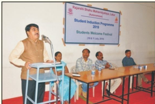
Student induction programme for First year students