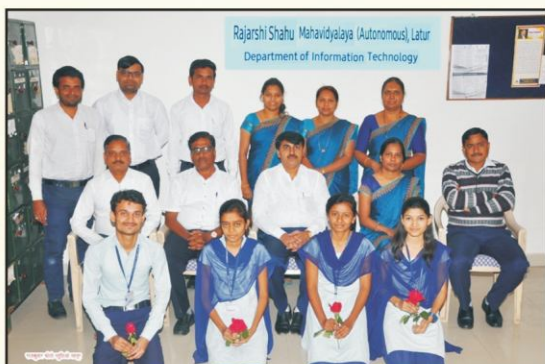
Students Selected in Campus Interview