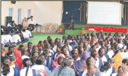
One day workshop on “Advanced Networking and Job Opportunities in Networking Sector”