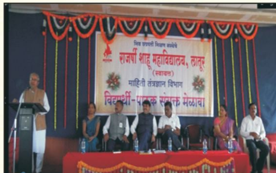
Student parent meeting