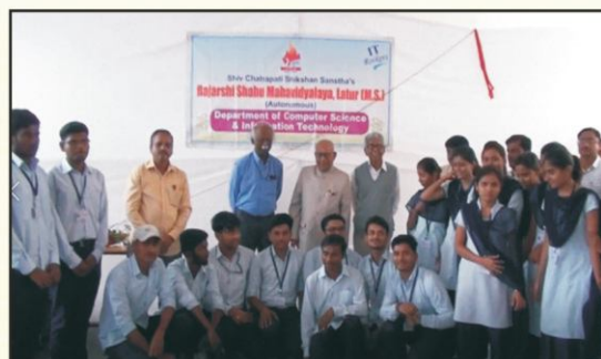
Felicitation of NPTEL online certification completed students-teacher