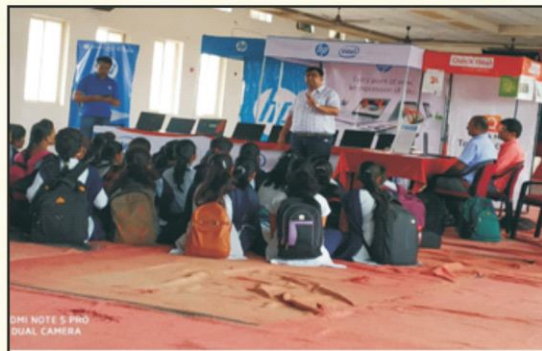
Student Meet for Laptop Awareness