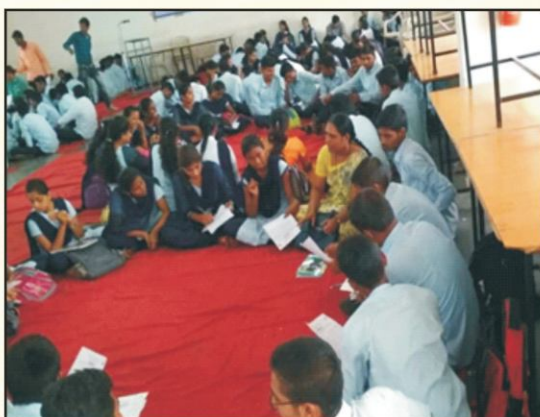
Student-to-Student Mentorship Programme for B.C.A., B.Sc.C.S.