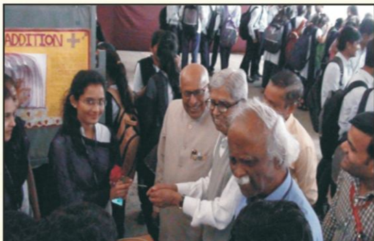
Mobile App Demonstration Developed by Students