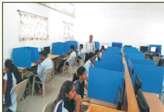
Students giving online exam