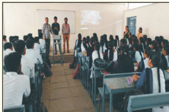
Workshop on Software/Hardware Installation, Maintenance and Support