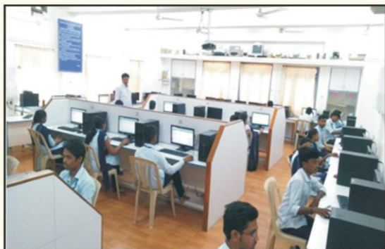
Students giving online exam