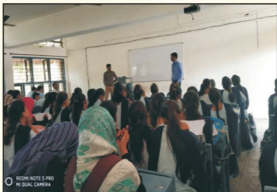
Guest lecture on Preparation of M.C.A. / M.B.A. entrance exam by alumni