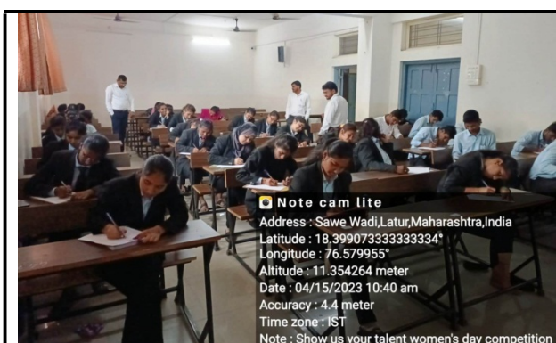
Students participate in Essay Competition