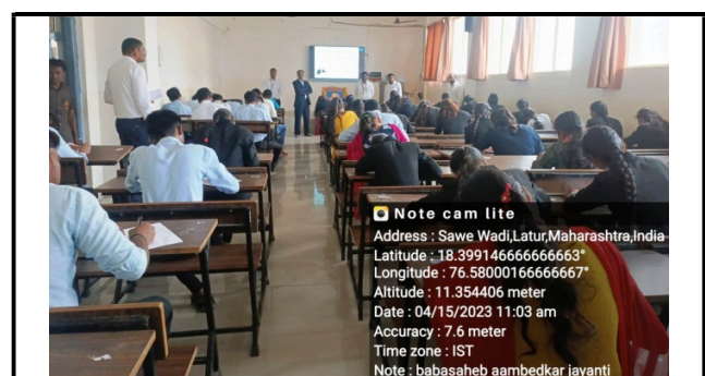
Students participate in Essay Competition