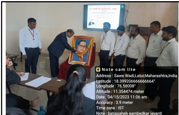
Greetings on the occasion of Dr. Babasaheb Ambedkar Birth Anniversary