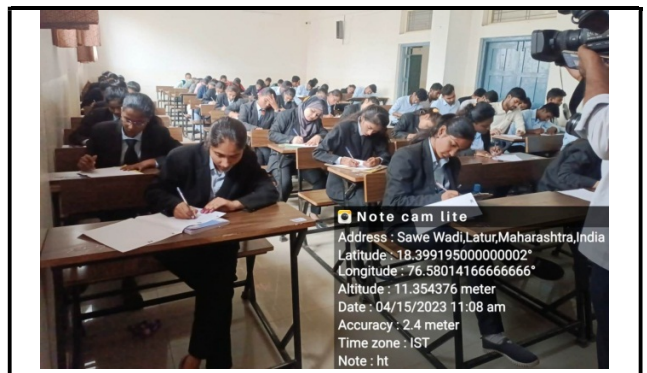
Students participate in Essay Competition