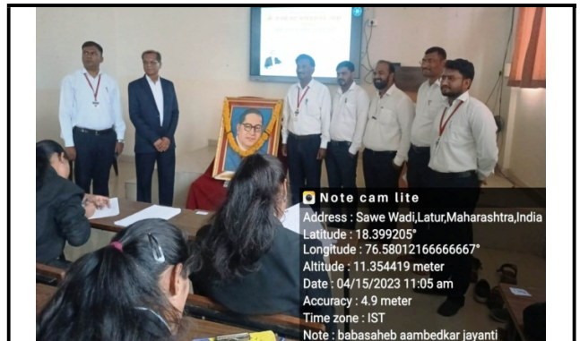
Greetings on the occasion of Dr. Babasaheb Ambedkar Birth Anniversary