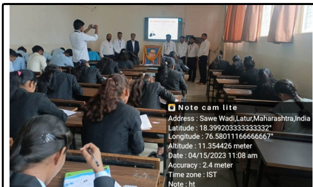
Students participate in Essay Competition