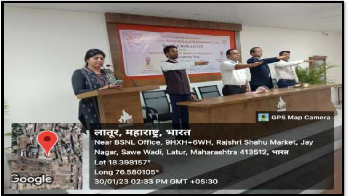
All dignitaries present on the dais while taking the oath

मी अशीही शपथ घेतो/घेते की, राष्ट्रपिता महात्मा गांधी यांच्या कुष्ठरोग मुक्त भारताचे स्वप्न पूर्ण करण्यासाठी नेहमी प्रयत्नशील राहील.