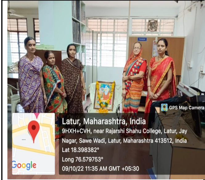
Non teaching staff participated in the Pandit Valmiki Jayanti jayanti