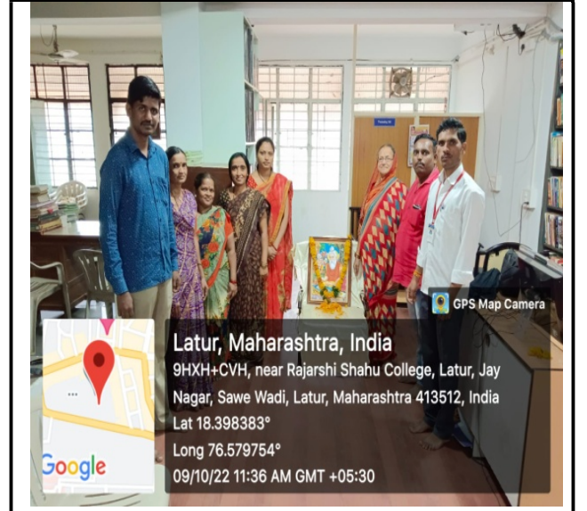
Non teaching staff participated in the Pandit Valmiki Jayanti jayanti program